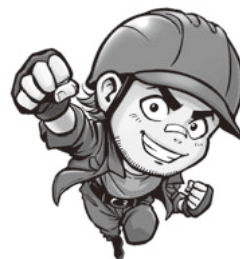
新キャラクターの「シン」

秋から始まる諸運動にあわせて、神奈川土建の新たなキャラクターが登場しました。これに合わせて、組合のホームページをはじめ、ポスターやパンフレットなどの広報宣伝物がいっせいに刷新されます。