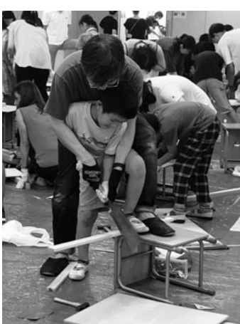
力合わせて共同作業

7月28日、9校の小学校で「夏休み親子の工作教室」を開催し、総勢約500人の親子に指導を行いました。事前の打ち合わせ会議や材料調達、前加工など、分会役員を中心に数力月前から準備を整えてきました。当日は暑さ対策を万全にして臨みました。冷房の利く教室や、冷風機を設置した日陰、風通しの良いピロティなど、各小学校で工夫を凝らした会場準備をしていたが、熱中症や大きなケガなどを発生させずに無事終えることができました。