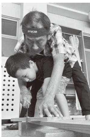
指導員の手を借りて

書記局員にとって機関紙づくりはセンスではなく、技術に裏打ちされた能力であるとして、10分間で400字を目標に記事作成の実習。出来あがった記事は、直ちにオンラインチャットで共有して合評が行われました。理論と実践が融合した充実の教宣講座が、今後の機関紙づくりに活かされることが期待されます。