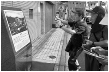
爆心地へおもむく

体が3倍にも膨れ上がった人の遺体、原子爆発と放射能被害に苦しめられた子ども達に関する事実や写真、絵などを見て涙が止まりませんでした。子どもの頃に被爆した体験等を伝える「被爆体験証言者」の話は胸に突き刺さりました。