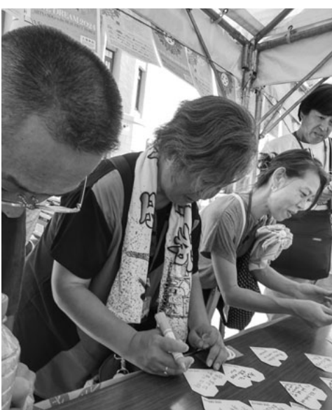
平和への願いをメッセージカードに

戦争被害の9割以上が一般市民による犠牲であることを平和資料館の講師から教わりました。今まで私が思い浮かべていた被害をはるかに上回る現実を知り、強いショックを受けました。未来のある子ども達が戦火に巻き込まれて犠牲になるなど、許されるはずがありません。「戦争は良くないこと」という、当たり前で大切な事実を次の世代にしっかりと伝えていく平和活動がとても大切だと思えました。