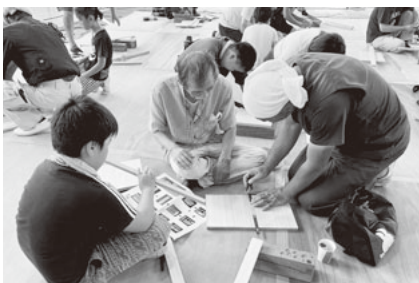
図面からの墨出しに一苦労