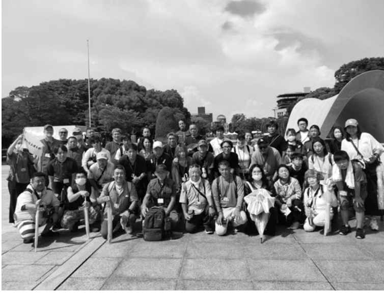
平和の灯の前で核兵器廃絶を誓う

爆建物を間近に見ると、何とも言葉で言い表せない気持ちになると同時に悲しくなりました。熱線に焼かれて包帯だらけの人、水を求めて爆心地をさまよう人、燃えさかる炎に耐えかねて川に飛び込んで亡くなり、