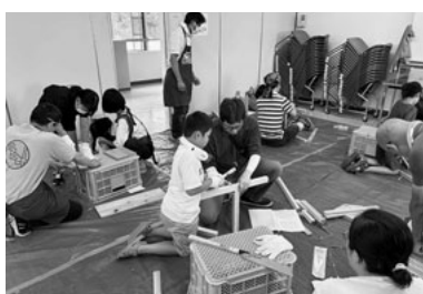
親子で力を合わせて

最高気温が35度を超えた7月28日、工作教室の会場となった潮田公園コミュニティハウスに駆けつけた子ども達は、冷房が効いた部屋に入った途端に「涼しい！」と歓喜の声。指導にあたった組合員からも「作業に集中でき安全」と好評を得ました。