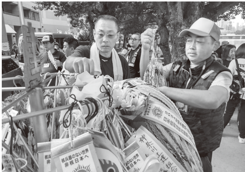
建設職人の碑に千羽鶴を献納

発行所 神奈川土建一般労働組合 〒221-0045 横浜市神奈川区 神奈川2-19-3 建設プラザかながわ ☎045(453)9806(代表) 発行人 西川 智幸 編集人 古溝 潤 定価60円 (神奈川土建の組合費には上記紙代を含む)