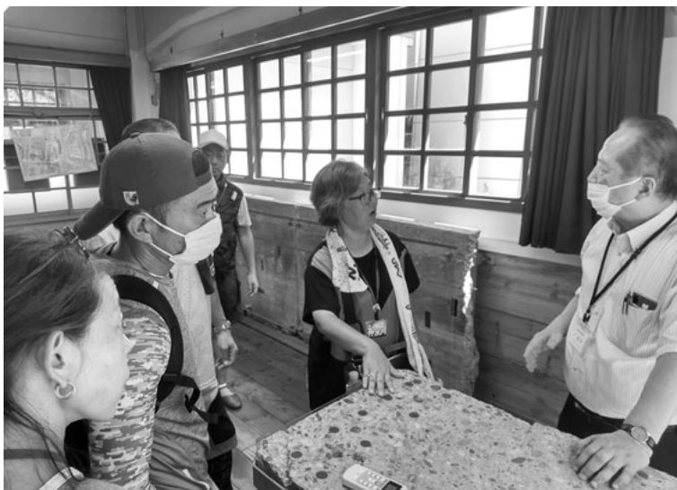
袋町小学校で遺構の解説を聞く

かる様に思いをめぐらせました。閉会総会のスピーチに登壇した方が「人間らしく生きることが出来なくなった、人間らしく死ぬ