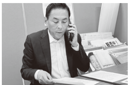
電話をかける篠原議員

神奈川県建設労働組合連合会は加盟単組と共同して、夏の地元国会議員要請行動を実施し、議員本人への面会を追求し、国保組合の予算確保への理解と協力を訴えまし