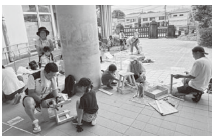
日差しを遮るピロティで作業

本町小学校の工作教室は恒例行事として定着しており、年々難易度をあげることでも達の技術力も上がっています。何より子ども達が夢中になっています。今年で2回目の参加となる親子は、家族で使えるティッシュボックス作成に嬉しそうに挑戦していました。その他、椅子の傾き調整できずに苦労していた子どもは、講師の職人が1分で直してしまい腕前にビックリ仰天。参加した保護者の感想では、コロナ禍以降、様々な行事が無くなったり、制限されたりしている中で、親子で参加できる行事を開催してくれるのはありがたいと述べました。