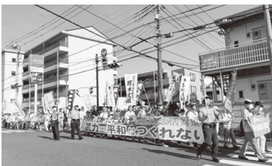
横断幕を掲げて行進

参加しました。米海軍厚木基地(大和市、綾瀬市)はオスプレイの整備拠点となつていますが、64人の死亡事故を起こしているオスプレイを、人口密集地にある同基地で整備・試験飛行することは許されません。構造的な欠陥が疑われるオスプレイのなし崩し的な飛行再開に不安を抱える世論を反映して、沿道からデモ行進に手を振る人や自動車のクラクションを鳴らして激励する市民の姿が多数見受けられました。