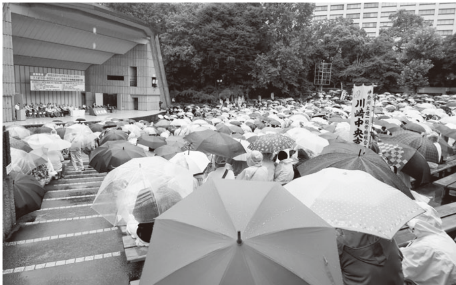
雨をついて日比谷野音に結集した仲間(上) 要求プラカートを掲げてシュプレヒコール(下)

異常気象による酷暑が続く中、安全を考慮して夏の中央総決起大会ではデモ行進は中止となりましたが、うだるような蒸し暑さにも関わらず、全国から日比谷野外音楽堂に多くの仲間が集まり、建設国保の育成・強化、建設技能者の処遇改善等をアピールしました。