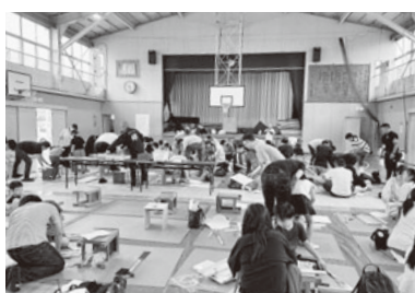
親子で工作に熱中

少しづつ難易度 上げて技術向上「平塚」 本町小学校の工作教室は恒例行事として定着しており、年々難易度をあげることでも達の技術力も上がっています。何より子ども達が夢中になっています。今年で2回目の参加となる親子は、家族で使えるティッシュボックス作成に嬉しそうに挑戦していました。その他、椅子の傾き調整できずに苦労していた子どもは、講師の職人が1分で直してしまい腕前にビックリ仰天。参加した保護者の感想では、コロナ禍以降、様々な行事が無くなったり、制限されたりしている中で、親子で参加できる行事を開催してくれるのはありがたいと述べました。